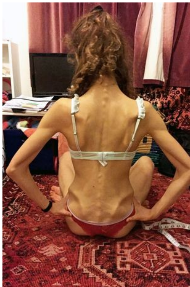
Slika 4: Balerina 18. g, oboljela od anoreksije