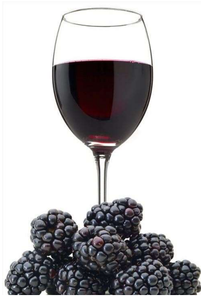
Slika 3. Kupinovo vino (27)