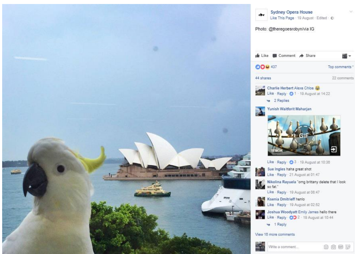
Slika 3. – Fotografija korisnika podijeljena na službenoj Facebook stranici institucije izazvala je oduševljene reakcije među pratiteljima

koju imaju kako bi vidjeli što se dogodilo jučer, što je “trend” u tom trenutku i kakvi se razgovori odvijaju. Nakon toga razgovara sa svojim timom što su napravili taj dan i kakve povratne informacije primaju od pratitelja. Postoji li možda nešto što bi moglo poslužiti operacijskom timu? Postoji li možda povratna informacija koja bi bila važna timu za organizaciju? Postoji li koji kvalitetan prijedlog koji mogu uvrstiti u šou? Postavlja li tko pitanje kojeg se nisu dotaknuli? Trebaju li pripremiti objavu vezano za određenu informaciju? Naglašava da prilikom objavljivanja sadržaja koriste geolokacijski alat. Uz to, ako je netko na mjestu događanja i nešto objavi te označi profil Sydney Opera House ili stavi njihovu lokaciju (slika br. 3), tim će vidjeti fotografiju i često ju podijeliti s javnošću. To je nešto što trude poticati jer vide vrijednost u tim iskrenim reakcijama. Način na koji to potiču je upravo putem digitalnih ekrana. Na primjer, osmislili su hashtag za Festival opasnih ideja - #fodi. I tijekom FODI festivala, imali su ogromne ekrane posvuda koji u stvarnom vremenu prikazuju što ljudi misle. Poticali bi rasprave i vodili interakciju s njima. Tim putem Sydney Opera House za društvene medije razvija osjećaj nacionalnog identiteta. (Hutchinson 2017)