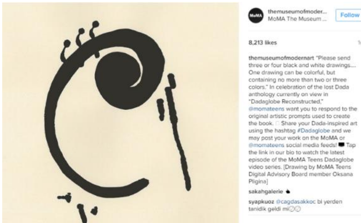
Slika 2. – Uključivanje korisnika u stvaranje sadržaja pod zajedničkim hashtagom