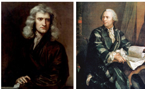
Slika 1: Isaac Newton i Leonhard Euler

Numerička matematika je disciplina koja proučava i numerički rješava matematičke probleme koji se javljaju u znanosti, tehnici, gospodarstvu, itd. U povijesnom razvoju začetaka numeričke matematike doprinijeli su Isaac Newton i Gottfried Wilhelm Leibniz u području prirodnih znanosti, a velike teorijske doprinose dali su Leonhard Euler, Joseph Louis de Lagrange, Carl Friedrich Gauss i dr. John Napier stvorio je logaritme kojima se množenje i dijeljenje moglo zamijeniti jednostavnijim zbrajanjem i oduzimanjem, a Charles Babbage izradio je prvo mehaničko računalo. Od sredine XX. stoljeća dostupnost elektroničkih računala dovela je do povećanja uporabe numeričkih matematičkih modela u znanosti, tehnici i ekonomiji.