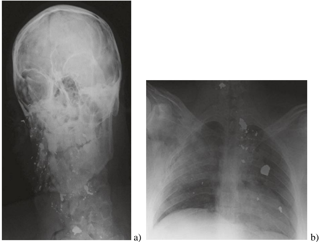
Slika 1: Metalno strano tijelo snimljeno konvecionalnom radiografijom u području a) kraniocervikalne regije i b) toraksa.