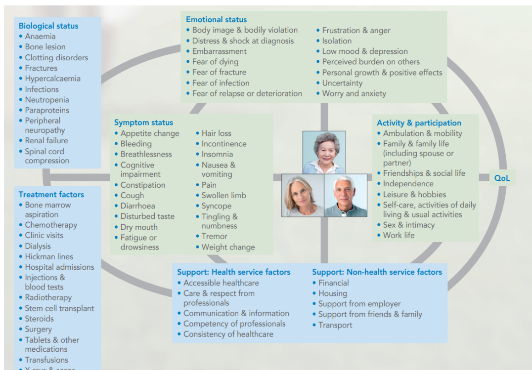
Slika 1. Čimbenici koji utječu na kvalitetu života bolesnika. Preuzeto iz: Osbourne TR, et al. Understanding what matters most to people with multiple myeloma: a qualitative study of views on quality of life. BMC Cancer. 2014; 14: 496. (27)

bolešću (prikazani na Slici 1.). Simptomatologija bolesti ima neizravan učinak na kvalitetu života, budući da utječe na ukupnu kvalitetu života samo ako djeluje na čimbenike kao što su aktivnost pacijenta, emocionalni status te faktori podrške koji imaju izravni učinak. Ovaj neizravni odnos ima implikacije na dizajn HRQoL upitnika, koji se često pogrešno temelje samo na simptomatologiji bolesti. Čimbenici liječenja pokazali su se važnima, iako ih često nema u upitnicima za procjenu HRQoL. (27)