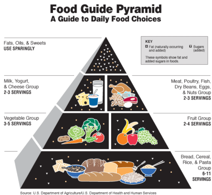
Slika 1. Prva piramida prehrane (9)

Povijest piramide pravilne prehrane zapravo potječe još iz 1894. godine, kada je američko Ministarstvo poljoprivrede prvi put izdalo vodič jednostavnih preporuka o pravilnoj prehrani. Nakon toga se neprestanim pokušajima istraživao najbolji model koji bi bio dovoljno zanimljiv da zaokupi pozornost šire populacije (8). Najprihvaćenije preporuke je objavio RDA (engl. Recommended Dietary Allowance ) 1989. godine u Sjedinjenim Američkim Državama, a dao je preporuke o dnevnim dozama hranjivih tvari (vitamina i mineralnih tvari), s obzirom na dob i spol te određena stanja kao što su trudnoća i dojenje. Konačno, prema tim preporukama američko Ministarstvo poljoprivrede 1992. godine je kreiralo prvu piramidu prehrane u cilju boljeg razumijevanja smjernica široj populaciji ili kao vodič pravilne prehrane (8).