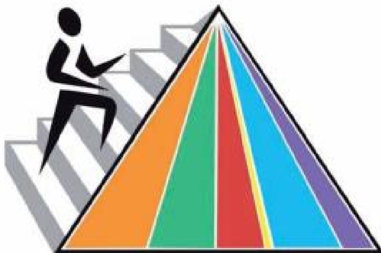
Slika 2. Moja piramida (7)

Razlikuje se u broju serviranja hrane te ima individualni pristup faktorima kao što su dob, spol te fizička aktivnost, čime se usvaja i planiranje prehrane za svaku osobu posebno. Sadrži šest boja koje piramidu dijele na šest dijelova te tako simboliziraju raznolikost i upućuju na odgovarajuće omjere svih skupina namirnica koje bi trebale biti zastupljene u prehrani. Sužavanjem svake linije od dna prema vrhu piramide je prikazana umjerenost. Namirnicama koje imaju manji postotak zasićenih masti i rafiniranog šećera, a pored toga su bogate vrijednim hranjivim tvarima, pripada šira baza piramide te bi one trebale biti najzastupljenije namirnice u prehrani. Piramidom je također prikazana proporcionalnost i to različitim širinama raznobojnih dijelova koji tako simboliziraju različite skupine namirnica. Spomenuta širina prikazuje koju bi količinu namirnica iz pojedine skupine trebalo konzumirati. Svaka širina određene skupine je tek okvirni pokazatelj i ne mora značiti točne proporcije. Točni podaci, odnosno upute, se mogu dobiti korištenjem aplikacije te upisom osobnih podataka. Kao podsjetnik na važnost dnevne tjelesne aktivnosti prikazan je obris čovjeka koji se penje stepenicama prema samom vrhu piramide, gdje stepenice simboliziraju postepen put prema pravilnoj prehrani (7,10). Kao i u ranijim piramidama, i u „Mojoj piramidi“ se namirnice svrstavaju u šest skupina: žitarice (narančasta boja), voće (crvena