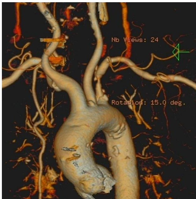
Slika 5. 3D CT angiografija prikaz luka aorte i njegovih ogranaka sa stenozom lijeve a.subklavie

CT angiografija - Kad ultrazvučne tehnike nisu uvjerljive i kontrastna MRA kontraindicirana, CT angiografija može se koristiti za isključivanje ili kvantifikaciju stenozne potključnih arterija. Smjer toka u vertebralnim arterijama se nemože odrediti ali se sve ekstrakranijalne i intrakranijalne vaskularne lezije mogu identificirati.(5)