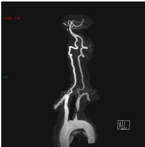
Slika 4. MRA prikaz stenozne lijeve potključne arterije