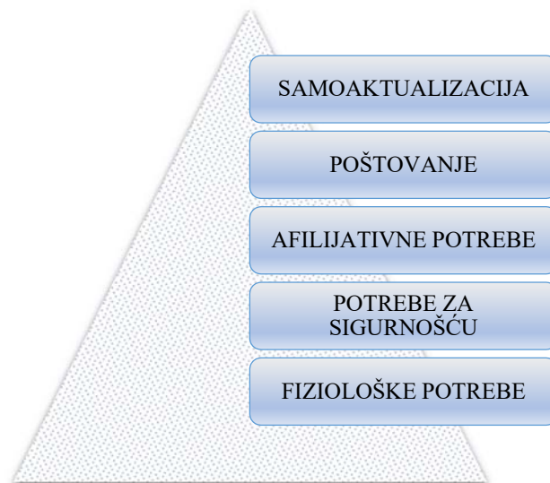
Slika 1. Maslowljeva hijerarhija potreba

Polazište u izradi koncepta sestrinske skrbi za starije osobe ima Maslowljeva teorija motivacije. Prema teoriji motivacije A.G.Maslowa životne potrebe svrstavaju se u pet kategorija; fiziološke potrebe, potrebe za sigurnošću, afilijativne potrebe, potrebe za poštovanjem te potrebe za samoaktualizacijom. (Maslow 1970.) (slika 1.)