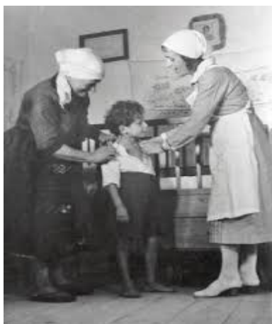
Slika 3. Sestra pomoćnica u kućnom posjetu