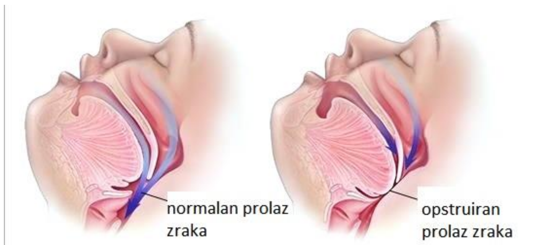
Slika 1. Opstrukcija dišnog puta mekim nepcem i bazom jezika (prema 9)

mogu održavati ritmično disanje i normalnu izmjenu plinova, dok oni s jako ugroženim gornjim dišnim putovima mogu razviti potpunu opstrukciju (9).