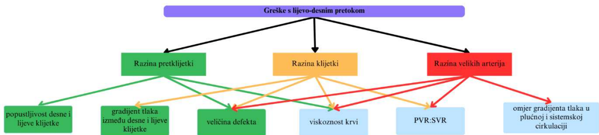
Slika 2. Patofiziologija lezija s lijevo-desnim pretokom. Utjecaj hemodinamskih čimbenika na veličinu protoka kroz šant; preuzeto i prilagođeno prema (64).