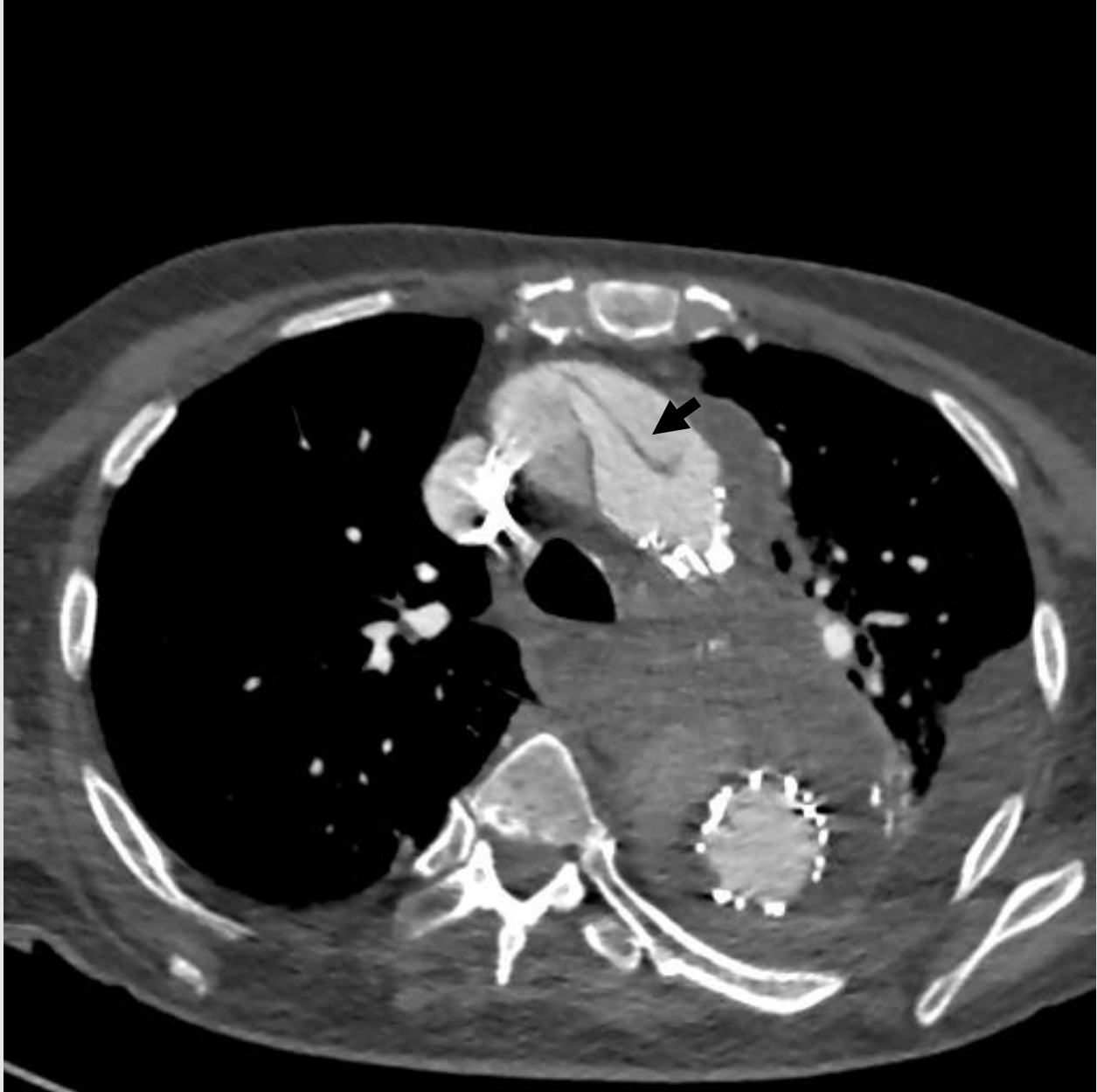
Slika 3. Retrogradna disekcija uzlazne aorte u bolesnika nakon TEVAR-a zbog disekcije Stanford B, s periaortalnim hematomom. Intimalni zalistak je označen strelicom.

Mortalitet RD-a nakon TEVAR-a značajno je viši nego kod spontane disekcije tipa A i iznosi od 33% - 42% (63). Prema istraživanju Al Seigha i suradnika od pacijenata koji su umrli zbog RD-a unutar mjeseca dana nakon TEVAR-a, 79,1% je umrlo tijekom operacije ili u prvim satima i danima nakon operacije (86). Zbog visokog rizika i smrtnosti, RD treba smatrati mogućom diferencijalnom dijagnozom u bilo kojeg pacijenata u JIL-u ili na odjelu