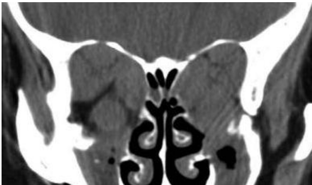
Slika 11. Koronarni presjek kroz orbitalni prostor sa izrazito zadebljanim EOM obostrano i radiološkim znakom KON-a.

Slikovne metode prikaza orbitalnog sadržaja su MSCT kojim se mogu jasno prikazati volumetrijske promjene orbitalnog tkiva kao i eventualno postojanje kompresivne optičke neuropatije (KON).