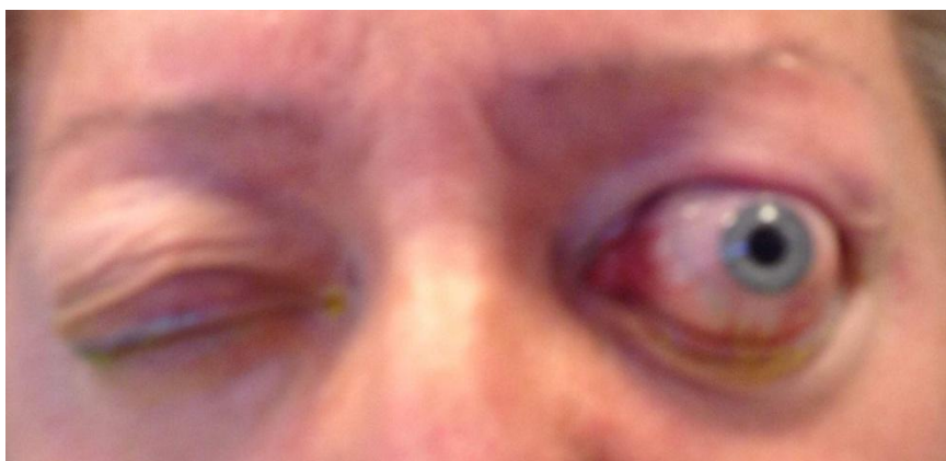
Slika 4. Subluksacija lijevog bulbusa pri pokušaju mjerenja intraokularnog tlaka

Jednako tako, hiperelastičnost veziva može dovesti do subluksacije bulbusa pri svakodnevnim manipulacijama oko vjeđa, što može rezultirati ekstremnim istezanjem vidnog živca.