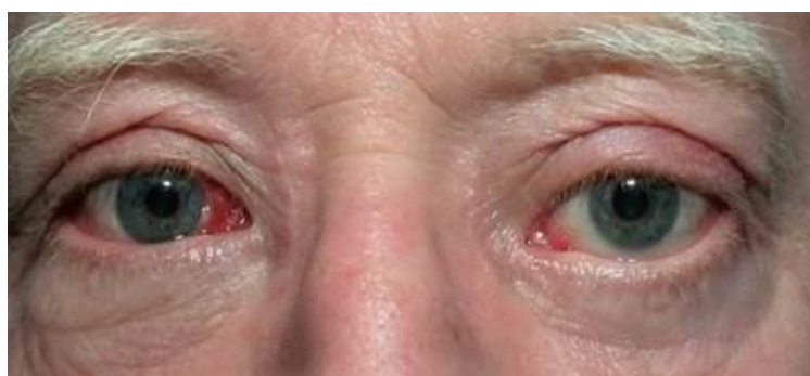
Slika 13. Prije i poslije koštane dekompresije, operacije na EOM i vjeđama