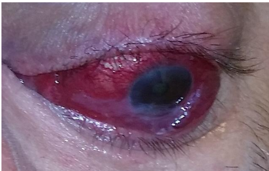
Slika 7. Ulkus rožnice uz izražene znakove zastoja

Zbog kompresivnog učinka u orbiti, promjena u strukturi i funkciji suzne žlijezde te posljedično promjeni sastava suznog filma bolesnici sa GO-om često se žale na smetnje od strane prednjeg segmenta oka. One mogu varirati od blagog osjećaja žuljanja, peckanja, crvenila do strukturalnih defekata, izrazite bolnosti i pada vida.