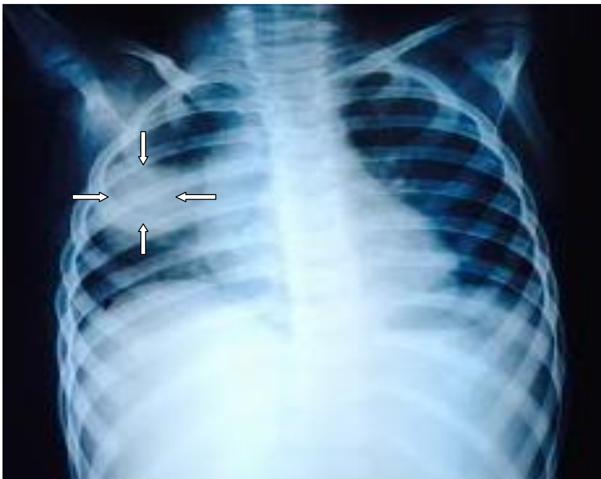
Slika 3. Okrugla pneumonija kod djevojčice u dobi od 2.5 godine.