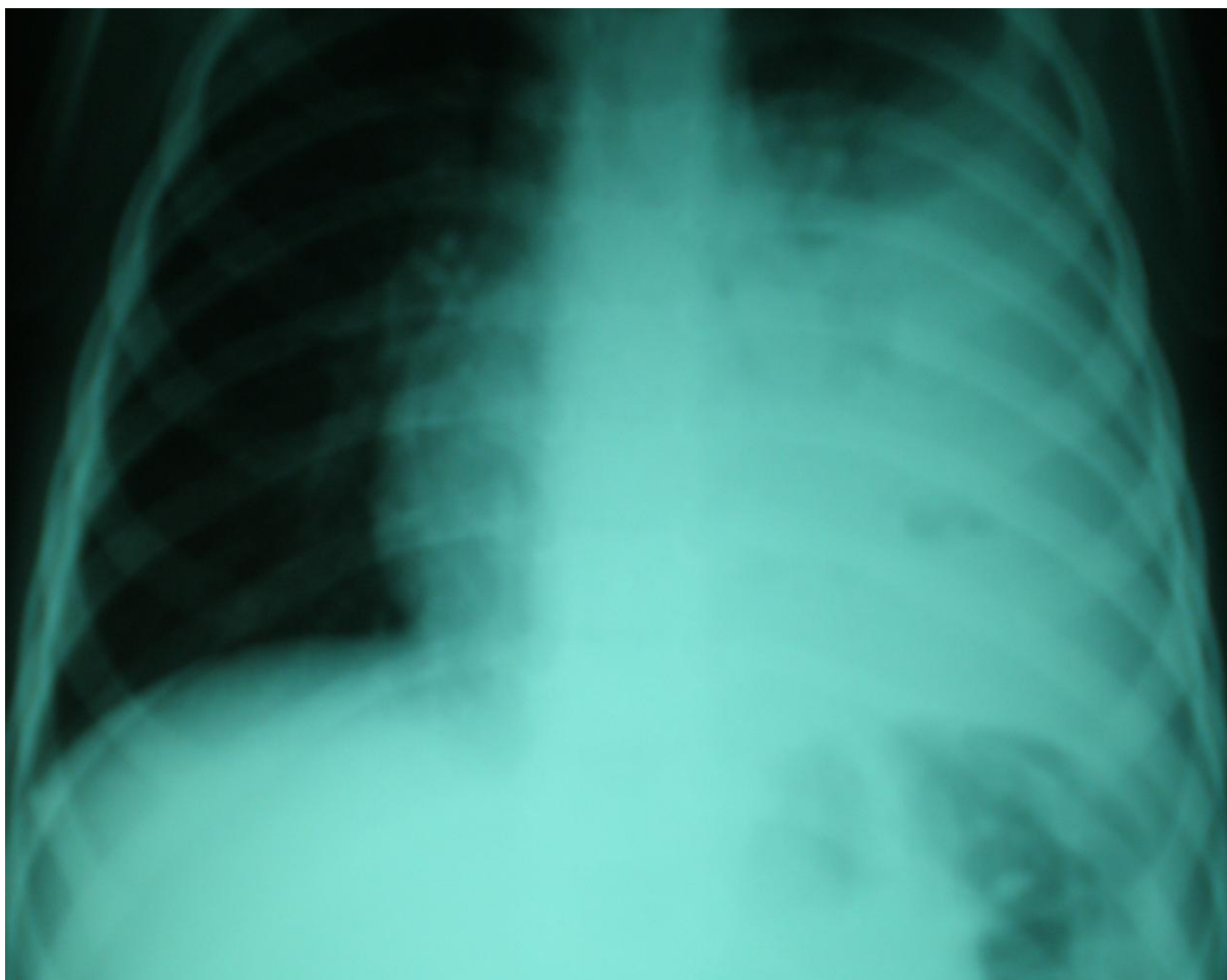
Slika 2. Lobarna pneumonija s početnim izljevom (dokazan UZV-om) uzrokovana pneumokokom. Dječak u dobi od 7 godina.