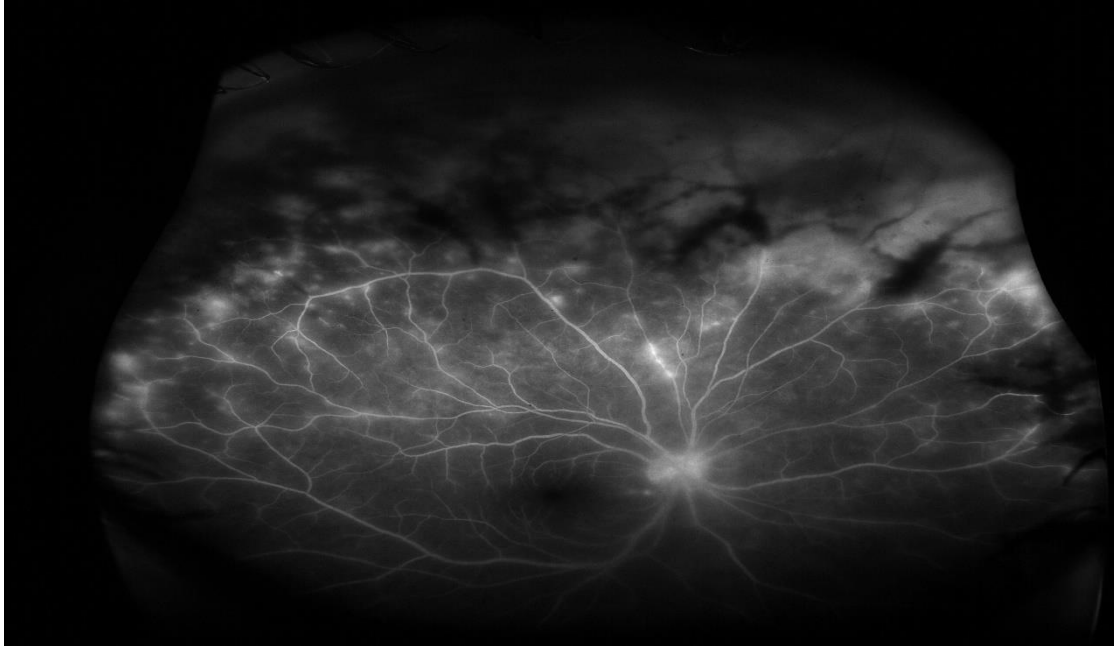
Slika 2. Nalaz fluorescinske angiografije

Bolest je shvaćena kao ARN, a na Kliniku za infektivne bolesti „ Dr. Fran Mihaljević“ bolesnica je zaprimljena zbog potrebe intravenskog antivirusnog liječenja aciklovirom. Svi daljnji postupci i liječenje provedeni su u dogovoru sa oftalmolozima iz KBCSM.