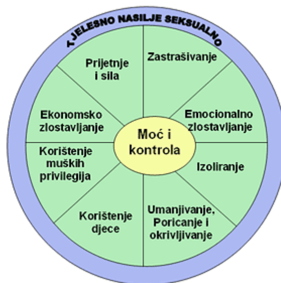
Slika 1. Kotač moći i kontrole (4)

Neovisno o autoru, iz definicije nasilja u obitelji vidljivo je da zlostavljač tijekom nasilnog partnerskog odnosa uspostavlja moć i kontrolu tijekom dužeg vremena, što je slikovito prikazano u "Kotaču moći i kontrole".