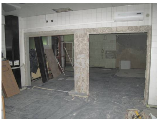
Slika 9. Prostor spremišta