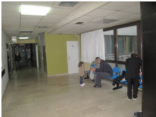
Slika 3. Prostor čekaonice

Projektiranje uređenja Odjela hitne medicine počelo je u travnju 2012. godine i završilo predajom projektne dokumentacije i troškovnika, građevinsko-obrtničkih i instalaterskih radova u lipnju iste godine. Ugovor za izvođenje radova potpisan je 19.07.2012. godine, a ugovorena vrijednost radova iznosi 557 304,61 kn. Za nabavku suvremene opreme i medicinskih uređaja iz Projekta unapređenja hitne medicinske službe i investicijskog planiranja preko zajmova Svjetske banke osigurana su 3 695 593 kuna. Za uređenje Odjela hitne medicine nabavljen je novi namještaj i ostala medicinska oprema u vrijednosti oko 100 000 kuna osiguranih iz vlastitih sredstava bolnice (Strikić et al.2012)