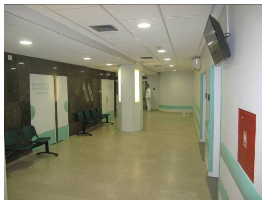
Slika 6. Čekaonica danas