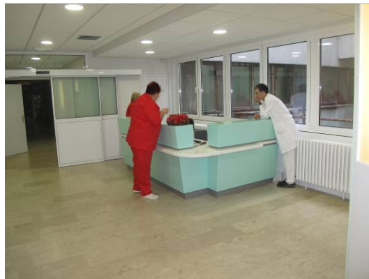
Slika 4. Danas Trijažni pult