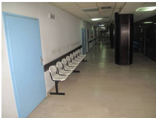
Slika 5. Čekaonica prije