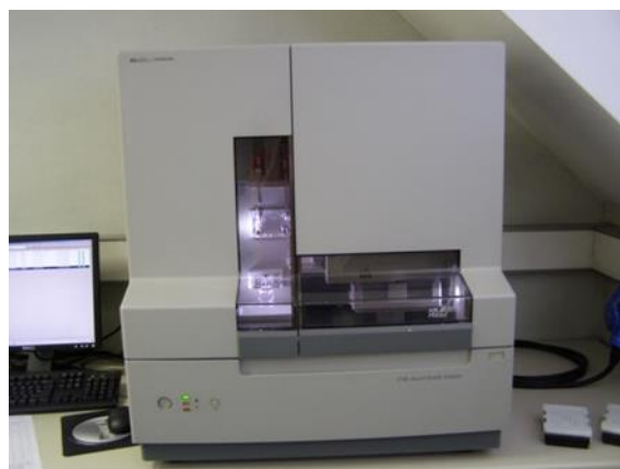
Slika 5. 3100-Avant Genetic Analyzer

Podaci i analiza genotipa se dobivaju prosječno svakih 30 minuta obrade tako što laser detektira fluorescentno označene uzorke DNA kada prođu kroz prozor detekcije. Velika prednost ove metode je što se ne iskoristi sav uzorak DNA tako da se postupak može ponoviti, a i nije potrebno nikakvo predznanje o kapilarnoj elektroforezi da bi se mogla izvoditi ova analiza (Butler, 2001.).