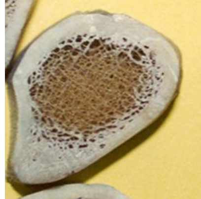
Slika 2. Uzorak bioloških tragova (kost)