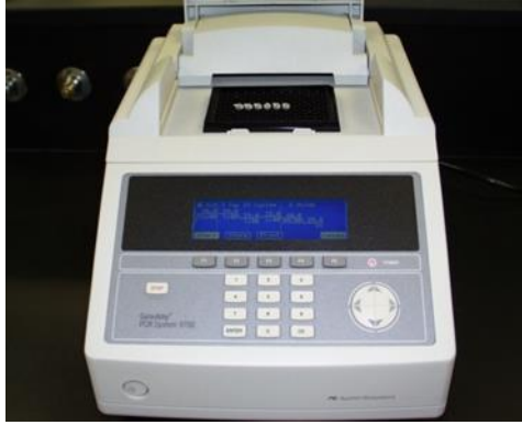
Slika 4. PCR Termocycler

Pri izvođenju PCR-a mora se paziti na sterilnost jer je mogućnost kontaminacije velika, npr. oljuštene stanice kože s ruku laboratorijskog osoblja. Ta nepoželjna DNA će se isto umnožiti što može dovesti do krivih rezultata. Tako da je korištenje lateks rukavica obavezno (Turnpenny, Ellard, 2011.).