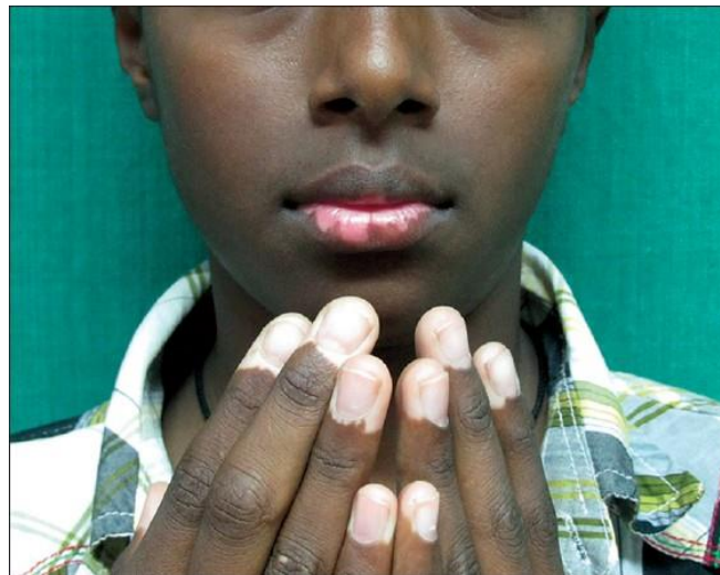
Slika 3. Akrofacijalni oblik vitiliga.

Postoji fokalni oblik vitiliga u kojem se pojavljuje izolirana bijela makula bez segmentalne distribucije. Može napredovati u segmentalni ili nesegmentalni oblik. Opisan je i mukozni oblik vitiliga kod kojeg je zahvaćena samo jedna sluznica (49).