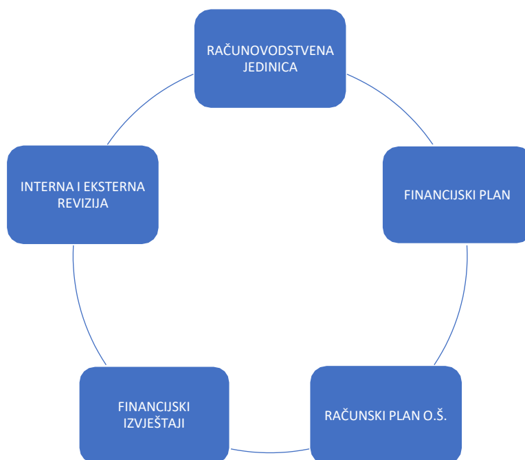
Slika 1 Elementi računovodstva osnovne škole

Na slici 1 prikazani su glavni elementi računovodstva osnovne škole, a to su: računovodstvena jedinica, financijski plan, računski plan škole, financijski izvještaji i interna i eksterna revizija. U daljnjem tekstu navedeni elementi bit će razrađeni.