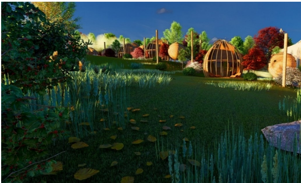
Slika 7. Vizualizacija bungalova