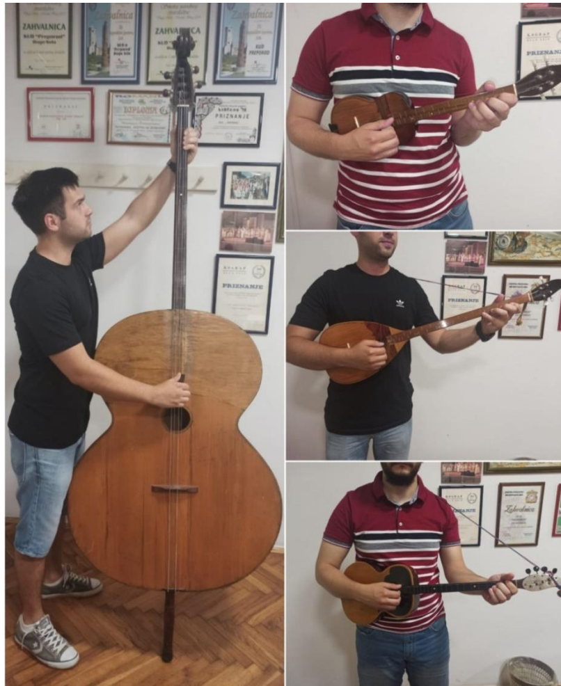
Slika 17: Držanje tambura Farkaševog sustava

Ono što je zanimljivo, a posve drugačije nego držanje tambure danas, je to što se kod Farkaševog sustava desna ruka trebala držati bliže vratu tambure, dok se na današnjim tamburama desna ruka drži paralelno s glasnjačom. Isto tako, Farkaš upućuje da se kod sviranja berde, berdu treba nagnuti prema lijevoj strani.