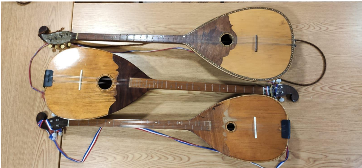
Slika 2: Bračevi Farkaševog sustava u vlasništvu KUD-a „Preporod“, Dugo Selo (fotografirano u prostoru KUD-a „Preporod“, Dugo Selo)

kromatsko – dijatonski na isti način kao i bisernice. (Ferić, 2011: 47). Farkaš tvrdi da je on najpotrebnije glazbalo tamburaškog zbora/orkestra, a zbog svog tona koji nije tako intenzivan kao kod bisernice, može izvoditi solo dijelove skladbe u orkestru ili nekom sastavu poput kvarteta. Također, može izvoditi cijelo djelo solo uz pratnju nekog drugog glazbala, npr. klavira. U većem sastavu često izvodi isto što i bisernica samo oktavu dublje s time da mu lijepo leže tužne i sentimentalne popijevke zbog kvalitete tona. (Farkaš, 1911: 41). Drugi i treći brač također su kruškolikog oblika, a sviraju prateću melodiju prvom braču pa se time dobiva troglasje u svirci. Imaju proširen opseg od kvinte u odnosu na prvi brač. Ugođeni su kromatski tako da se na prve dvije žice svira kromatski tonovi D – dur ljestvice, a na druge dvije žice kromatski tonovi G – dur ljestvice. (Ferić, 2011: 48). Treći brač nešto je veći od drugog i on najčešće svira tercu ili sekstu naspram prvog brača. Drugi i treći brač potrebni su tamburaškom orkestru zbog svojih naizmjeničnih sviranja raznih figura i glazbenih sastavnica poput uklona i modulacija tvoreći zajedno s prvim bračem razne harmonije i suzvučja. (Farkaš, 1911: 47).