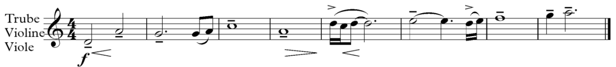
Primjer 10: Gondor u uspinjanju

Prva četiri takta su ista kao u originalnoj temi, dok sljedeća četiri uključuju motiv družine te postepeno uzlazno kretanje, što simbolizira pobjedu Gondora. Ova varijacija se razlikuje od Gondora u propadanju , gdje melodija silazi, što prikazuje propadanje kraljevstva.