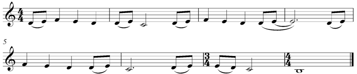
Primjer 3: Zavodljivost Prstena

Jedan od lajtmotiva Prstena je tema koja se najprije izražava pjevanjem dječaćkog zbora dok Frodo nosi Prsten u svom plaštu. Shore je aspekt privlačnosti i nevinosti Prstena uspio prikazati zborom dječaka koji pjevaju melodiju teme dok ih prate udarci bas bubnja. Ostali instrumenti sviraju pedalnu kvintu 'a – e' u dugim notnim vrijednostima. Ova tema ostaje prilično dosljedna tijekom priče i rijetko mijenja orkestraciju (za razliku od mnogih drugih tema). Lajtmotiv se također pojavljuje kada Boromir drži Prsten na lancu. Privučen snagom Jedinog, Boromir u Prstenu vidi rješenje. Također je to prvi put da se tekst lajtmotiva pjeva. Oslobođen nevinih, svijetlih glasova dječaćkog zbora, Prsten zarobljava Boromira. On gleda na Prsten gotovo s ljubavlju, ne shvaćajući kako iz ove „male stvari“ može proizaći tolika opasnost.