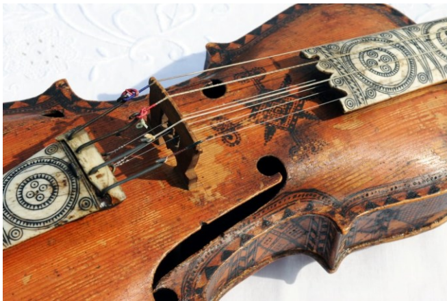
Slika 3: Hardanger fiddle (Hardanger violina)

Ovaj norveški gudački instrument s osam do devet žica koristi se za stvaranje zvukova koji su predstavljaju Rohanski narod i njihove epske bitke.