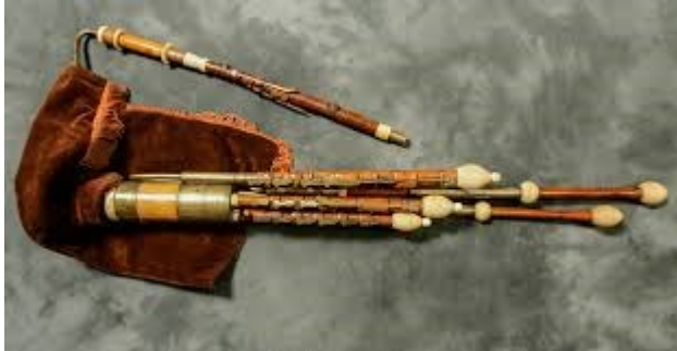
Slika 2: Uilleann pipes (irske gajde)

Kada se pojave scene koje prikazuju Shire, poput Frodovih povrataka ili mirnih trenutaka u Hobitskoj zemlji, irske gajde stvaraju melankolične melodije koje odražavaju ljepotu i spokojstvo tog mjesta.