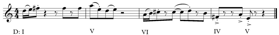
Primjer 6: Seoska varijacija

Seoska varijacija sastoji se od dva dvotakta, pri čemu svaki započinje prepoznatljivim motivom glavne teme, s time da se u drugom dijelu motiv pojavljuje za kvartu niže. Pauze u ovoj varijaciji stvaraju plesni, ritmički element i doprinose veselom ugođaju, dok se uz osnovne harmonije I, IV i V stupnja pojavljuje i VI stupanj, što dodatno obogaćuje harmonijsku strukturu.