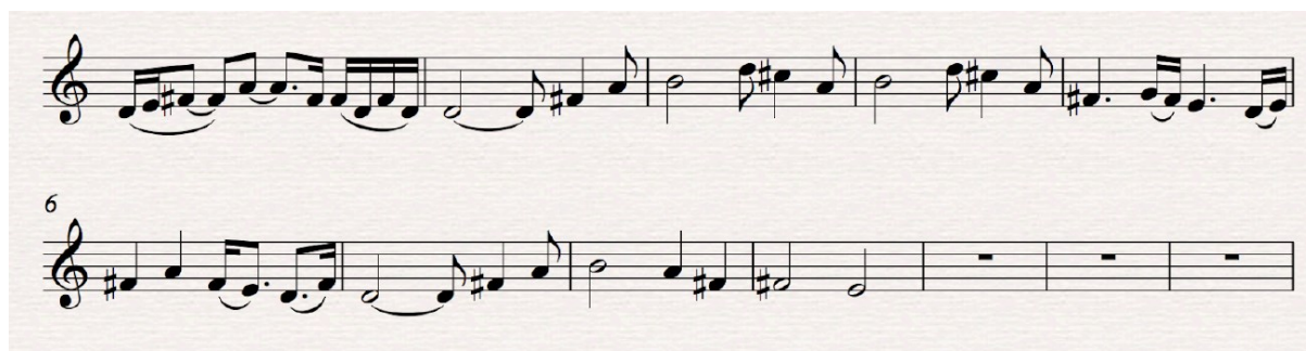
Primjer 4: U snovima

Tema, napisana u D-duru, sastoji se od dvije jednostavne rečenice, pri čemu prva završava na petom stupnju te čine periodu. Melodija se razvija prema vrhuncu, dok su harmonije jednostavne, s osnovnim akordima I, IV, V i III stupnja. Prvo ju izvode gudači, a kasnije im se pridružuje dječjački solo glas uz povremenu pratnju zbora