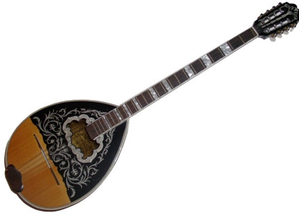
Slika 4: Bouzouki

s okruglim tijelom s ravnim vrhom. Ima čelične žice i svira se s trzalicom te proizvodi oštar metalni zvuk, koji podsjeća na mandolinu, ali nižeg tona. Njegov zvuk odražava etničku raznolikost i povijesne aspekte priče. U scenama koje prikazuju putovanje kroz različite pejzaže Međuzemlja, bouzouki dodaje element avanturizma, simbolizirajući putovanje i borbu likova.