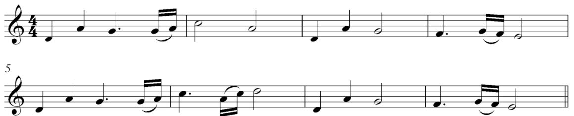
Primjer 8: Kraljevstvo Gondor

Tema se sastoji od dvije dvotaktne fraze koje se ponavljaju, stvarajući kratku rečenicu, pri čemu se prva fraza ponavlja s varijacijama. Obje fraze započinju na isti način, ali završavaju različito. Svaka fraza počinje karakterističnom kvintom. Prva fraza ima uzlaznu tendenciju, dok druga ima silaznu, pri čemu se odnose jedna na drugu poput pitanja i odgovora. Melodija teme je u prirodnom d-molu, dok se harmonije izmjenjuju između D-dura i d-mola, sastojeći se od jednostavnih kvintakorada i sekstakorada. Ove harmonije se mijenjaju na svaku drugu dobu, stvarajući specifičan ritam i dojam čvrstine, te u suštini djeluju kao zvučni stupovi.