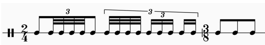
Slika 17. Moj zapis 34. takta.

Od slova C do E je najbitnije točno pročitati zadani prstomet. Cijeli dio je kombinacija dosad naučenih rudimenata, ali korišten na jako zanimljiv način i u raznim dinamikama. U slovu E javljaju se rimshot udarci. Preporučuje se sviranje rimshoteva jednom rukom, a ostale note drugom rukom. Isto kao i u drugom stavku "Trommel suite". Ostatak slova E je vrlo kratak, ali jako težak za točnost izvedbe. U desnoj imamo prateći ritam koji je dosta brz te bi ga trebalo vježbati samo u brzom tempu zbog kontrole palice, što znači da se mora svirati od samog odbijanja palice, a ne izigravati svaku notu iz zgloba i prstima. Uz taj motiv, lijeva ruka svira, recimo, solo dionicu. Slijedeći težak dio je slovo G. U prva četiri takta preporučuje se isti prstomet kao i u početku slova. Jedna ruka svira samo rimshoteve, a druga uobičajene udarce. Nadalje, kroz slova G i H, prstomet bi se trebao postaviti onako kako bi se svirale sve triole bez predudara, odnosno izmjeničnim prstometom. Na taj prstomet bi se dodali predurari po istom principu kako je objašnjeno i u Prímu . Prstomet dvostrukih i trostrukih predudara je odabir studenta. Ovisno kako je Prím pomogao studentu u tehnici, tako će i odabrati prstomet.