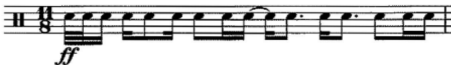
Slika 13. Á. Másson: "Prím "; 1. takt

gledati kao zapisanu u dvotaktu 4/4 i 3/8. Npr. prvi takt kao 3/8 plus 4/4 te iznad grupe zamišljene kao 3/8 stavio luk. Taj princip može se primijeniti na ostatak skladbe kako bi se uvelike olakšao proces čitanja i izvedbe. Razmjestaj grupe od 3/8 može varirati od takta do takta, ali luk zapisan iznad grupe u potpunosti mijenja vizualnu sliku (vidi sliku 13, 14, 15).