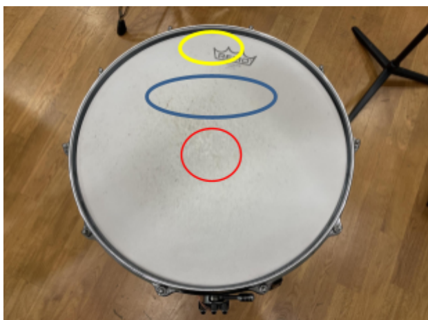
Slika 2. Žuta - rub; Plava - prostor između ruba i centra; Crvena - centar

Sa ovim dolazimo i do treće bitne stavke Intrade a i cijele suite a to je dinamika. Kroz cijelu suitu student bi trebao znati odsvirati sve dinamičke promjene. Za vježbu bi se trebalo i pretjerivati u dinamikama, pogotovo u onim najtišim i najglasnijim.