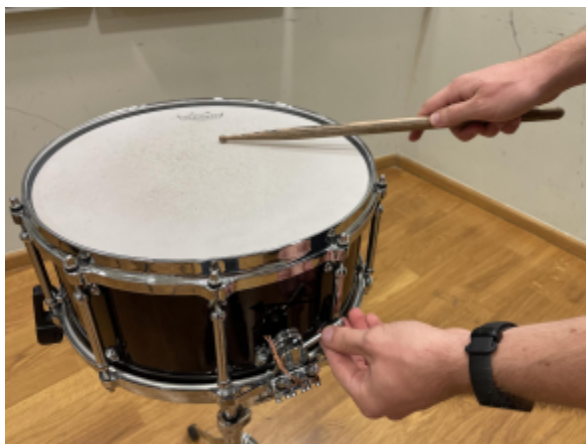
Slika 6. Smjer uključivanja mrežice bubnja.

Slika 5. U notnom zapisu stranica 5, red 5, takt 4.