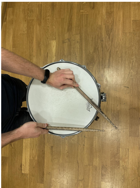
Slika 23. Palica o rub bubnja.