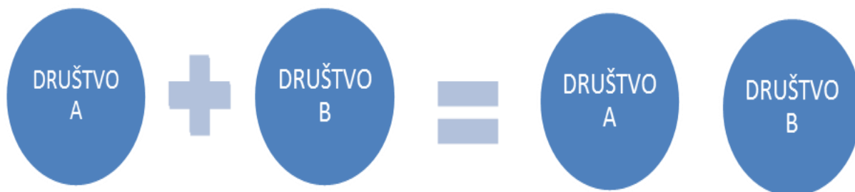
Slika 3 Grafički prikaz povezivanja