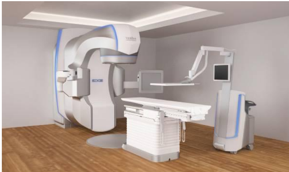
Slika 2. Linearni akcelerator