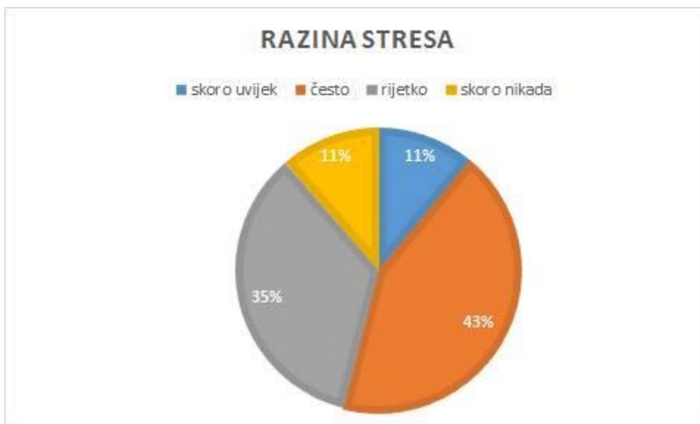
Slika 1. Prikaz razine stresa u ukupnom broju ispitanih primalja

Od 30 ukupno ispitanih primalja koje rade u KBC-u Splitu, na odjelu babinjača i u rađaonici, 16 (54%) ih se nalazi u području stresa, dok je njih 14 (46%) u niskom stupnju stresa.