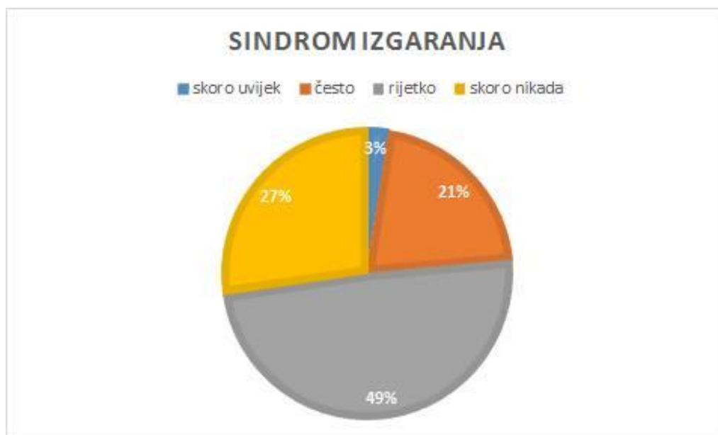
Slika 4. Prikaz razine sindroma izgaranja u ukupnom broju ispitanih primalja

Rezultati istraživanja razine sindroma izgaranja: