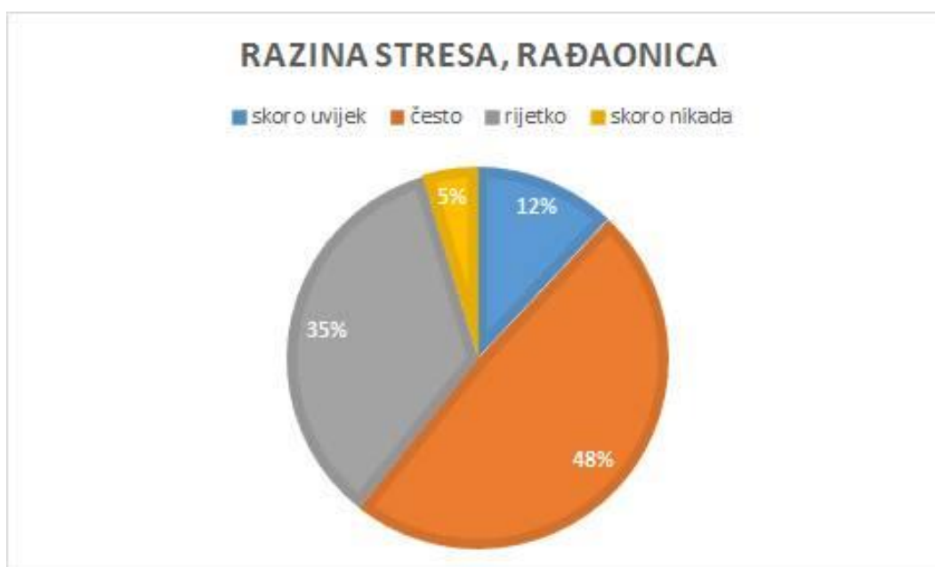
Slika 3. Prikaz razine stresa u postotcima u rađaonici

Na ove dvije slike prikazana je ukupna razina stresa na odjelu babinjača i u rađaonici u KBC-u Split.