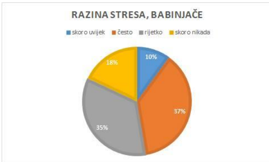
Slika 2. Prikaz razine stresa u postotcima na odjelu babinjača