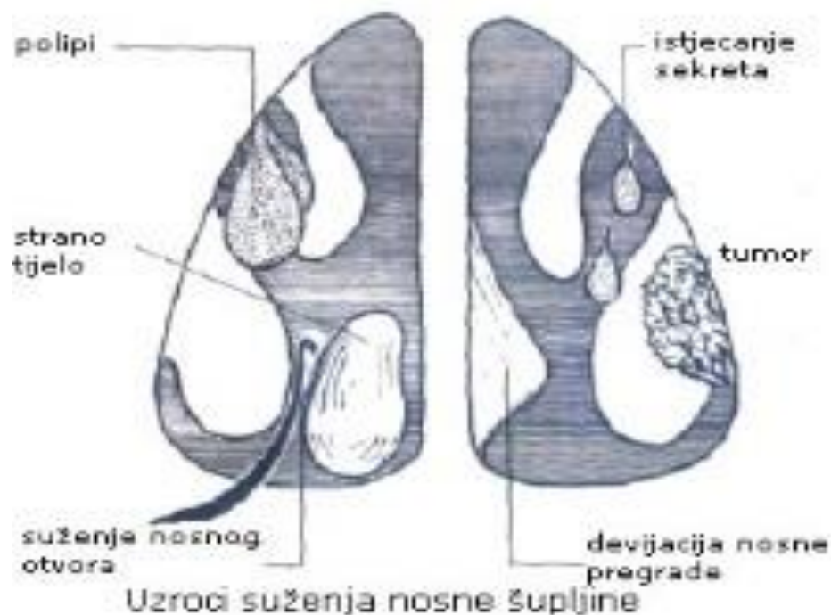
Slika 1. Uzroci suženja nosne šupljine

nerijetko susrećemo i druge patološke poremećaje (npr. septum nosa i polipi) koji dovode do komplikacija i problema u odvijanju normalnog rada receptora nosne šupljine, odnosno prirodnih i pravilnih funkcija respiratornog sustava (14). Premda je popis bolesti gornjeg respiratornog sustava veoma velik i dug u ovom radu se najčešće spominje devijacija septuma zbog relativno velike učestalosti i bitnog utjecaja na strujanje udahnutog zraka kroz nosnu šupljinu.