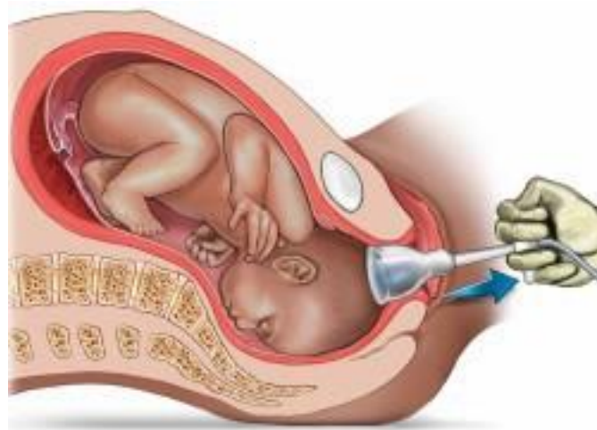
Slika 2. Vakuum