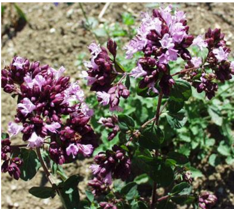
Slika 2. Origano (Anonymus 3, 2019)

Kao aromatična i ljekovita biljka vrlo je bogata eteričnim uljima koja cijeloj biljci daju ugodan miris. Glavne sastavnice eteričnog ulja su: karvakrol, timol, p -cimen, cis -ocimen, \gamma -kardinen. Osim eteričnih ulja sadrži i gorke tvari, tanin i dr. Na sadržaj eteričnih ulja značajan utjecaj imaju ekološki čimbenici i klimatske prilike u kojima biljka raste. Broj i veličina žlijezda na listovima kao i pricvjetnih listova i cvjetova znatno se razlikuju u uzorcima bilja ovisno o području prikupljanja. U našoj se zemlji idući od juga prema sjeveru oni znatno smanjuju, a time i sadržaj eteričnog ulja u pojedinoj biljci. Vrijeme prikupljanja također može znatno utjecati na količinu eteričnog ulja i na količinu njegovih glavnih sastavnica. Količina eteričnog ulja kod biljaka prikupljenih u ljetnom periodu značajno je viša od one kod biljaka prikupljenih u jesenskom periodu (Carović i sur., 2004). Djelovanje i uporaba origana: potiče probavu, poboljšava rad jetre i žučnog mjehura (Toplak-Galle, 2001). Ulje origana se koristi za proizvodnju sapuna, deterdženata i parfema (Carović i sur., 2004).