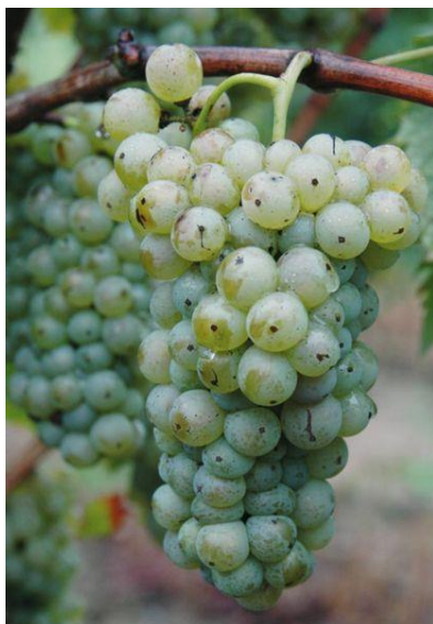
Slika 1. Grozd sorte Graševina bijela

Graševina je u vinogradarskom sortimentu Republike Hrvatske (RH) zacijelo najzastupljenija vinska sorta bijeloga grožđa (Slika 1). Pravilnikom o vinu (NN 159/04.) uvrštena je među preporučene kultivare u svim podregijama regije Kontinentalna Hrvatska, zbog toga što kontinentalna Hrvatska ima klimu sličnu Francuskoj iz koje sorta potječe.