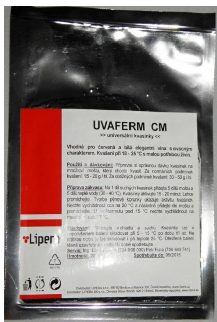
Slika 5. Uvaferm CM

Uvaferm CM je komercijalni pripravak kvasca Saccharomyces cerevisiae , kojeg su selekcionirali Sveučilište Davis i Lallemand (Slika 5). Uvaferm CM-a karakteriziraju snažan početak vrenja, ravnomjerno završno vrenje, dobra tolerancija temperature, dobar kapacitet vrenja (6,8 g šećera/L daje 1 vol. % alkohola), osrednje pjenjenje te činjenica da ne stvara sumoprovodnik ni hlapljive kiseline. Fermaid E je kompleksna hrana za kvasce koja sadrži stanične stjenke kvasca (hranu potrebnu za razmnožavanje), kako bi se alkoholna fermentacija odvijala što efikasnije, posebno kada je dušik ispod optimalne razine. Korištenje adekvatne hrane za kvasac sprječava presporu fermentaciju i zastoje iste. Najčešći uzroci zastoja fermentacije su: temperaturni stres, slaba adaptacija populacije kvasca, visoki alkohol, nedostatak hrane i faktora neophodnih za preživljavanje kvasca (Anonimus 6).