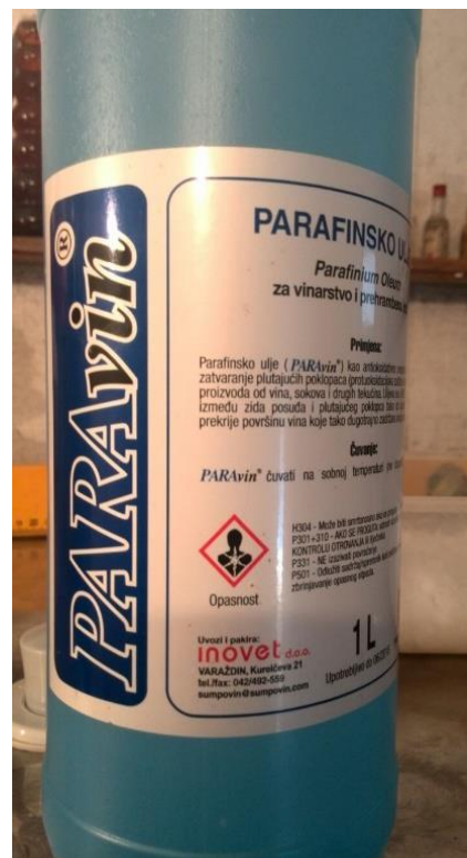
Slika 10. Parafinsko ulje