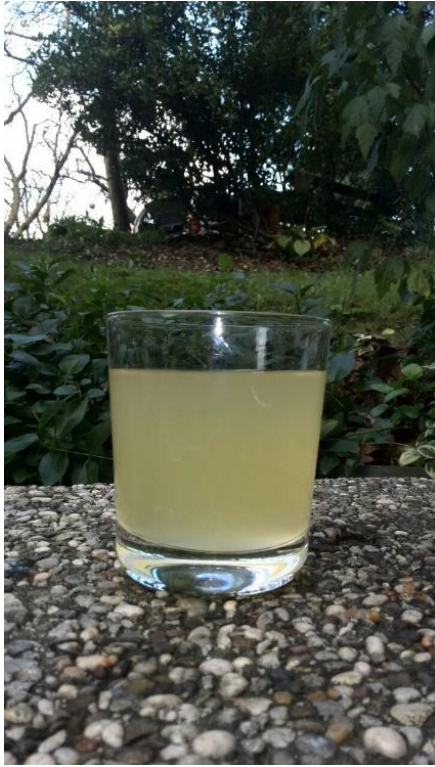
Slika 8. Bistrenje vina