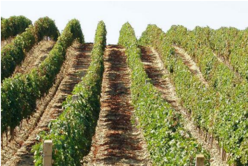
Slika 3. Iločko vinogorje

koje ovaj kraj ima za uzgoj vinove loze, te uveo nove, kvalitetnije sorte podrijetlom iz Grčke. Nakon oslobođenja od Turaka, kneževska obitelj Odescalchi obnovom dvorca nadograđuje, proširuje i modernizira podrumarstvo i vinogradarstvo te sam vinski podrum koji je prvotno građen u 15.st. Ovi napredni talijanski plemići u 17.st. donose u Ilok između ostalog i sorte Traminac te Zeleni silvanac i podižu nove nasade. Danas je iločki Traminac prema rječima struke ponajbolji u Hrvatskoj i šire, čemu u prilog govori činjenica da je poslužen na svečanosti krunidbe engleske kraljice Elizabete II., a i prije toga je bio uvršten među vina koja se poslužuju na engleskom kraljevskom dvoru. Pored Traminca tu su i Graševina, Rajnski rizling, Chardonnay, Pinot, Frankovka, Cabernet sauvignon, Merlot i brojne druge sorte. U drugoj polovici 20. stoljeća vinogradarstvo, voćarstvo i vinarstvo većim dijelom su bili predmet aktivnosti zadruga, kada se podižu prvi i najveći plantažni nasadi vinograda na prostorima bivše države. Nakon povratka Iločana iz progonstva 1998 g., obnovom, privatizacijom i društvenom reorganizacijom sve je veći broj manjih, privatnih vinogradara i vinara. Podignuto je oko 600 hektara novih nasada, te je sada pod vinogradima oko 1700 hektara zemlje koja trenutno broji oko 300 vinogradara i 17 vinarija (Anonimus 5).