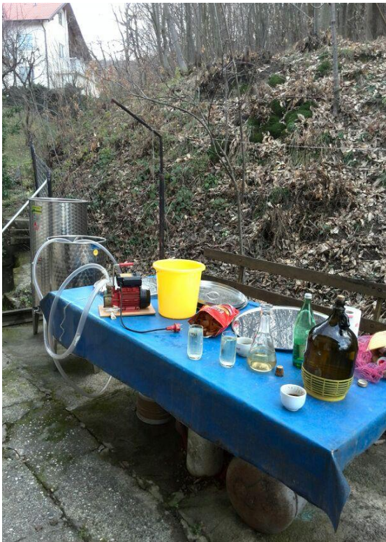
Slika 9. Oprema za pretakanje vina