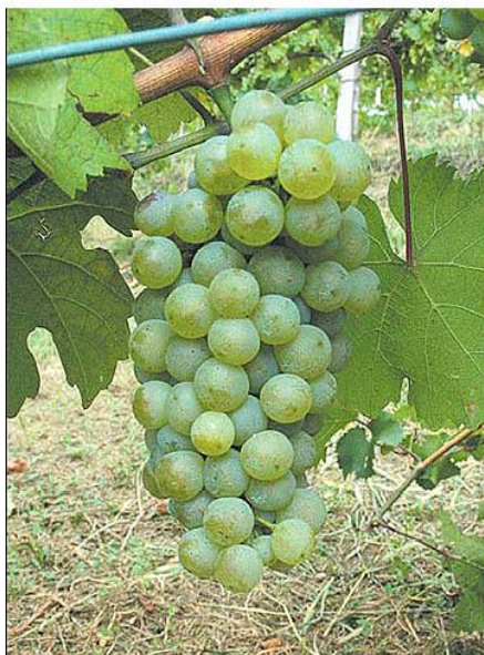
Slika 2. Grozd sorte Rajnski rizling bijeli

http://www.loznicijepovi.hr/images/proizvodi/rajnski%20rizling.jpg