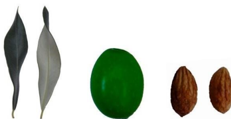
Slika 1. List, plod i koštica sorte istarska bjelica. (Institut i uzgoj maslina, 2020)

Ulje koje se dobiva iz istarske bjelice karakterizira snažna pikantnost i gorčina. Srednje je izražena voćnost, a prevladava aroma lišća, trave, radiča i aromatičnog bilja, te spada u jako izražena neharmonična ulja (Maslinar, 2019). Istarska bjelica prema Brkić i sur. (2006) sadrži 47,7 – 49,1 % ulja na suhu tvar. Ovo ulje izuzetno je bogato fenolima, te su Koprivnjak i suradnici (2012) odredili maseni udio ukupnih fenola u uzorcima ulja od 642,0 \pm 61,7 mg/kg, što je dva do četiri puta više u usporedbi sa ostalim sortama.