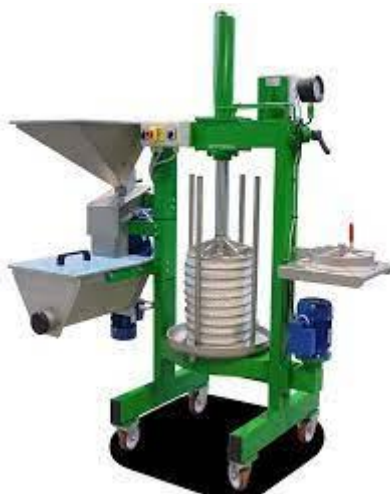
Slika 4. Mlin čekičar (Enotecnica Pillan, 2023)

Nakon pranja i čišćenja, masline su prošle fazu mljevenja i drobljenja. Za mljevenje maslina korišten je mlin čekičar, Oleum 30 Compact (Enotecnica Pillan Oleum 30 Compact, Camisano, Italija). Mljevenje je trajalo nekoliko minuta te je tijesto sakupljeno na izlazu.