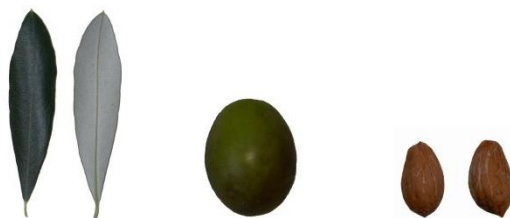
Slika 2. List, plod i koštica sorte rosulja. (Institut i uzgoj maslina, 2020)