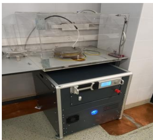
Slika 5. Obrada maslinovog tijesta PEP uređajem