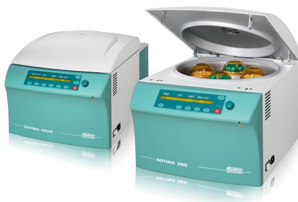
Slika 7. Centrifuga (Hettich Rotina, 2023)

Tuttlingen, Njemačka) centrifugi. Velike kivete napunjene maslinovim tijestom centrifugirane su 5 minuta na 5000 okretaja nakon čega je tekući dio (ulje i vegetabilna voda) odvojen u laboratorijsku čašu od 400 ml. U drugoj fazi centrifugiranja falkonice od 50 ml su napunjene s tekućim dijelom i centrifugirane 5 minuta na 5000 okretaja. Vegetabilna voda ostala je u donjem sloju dok se ulje prelijeva iz gornjeg sloja. Ulje je skladišteno u tamnim staklenim bocama od 250 ml.