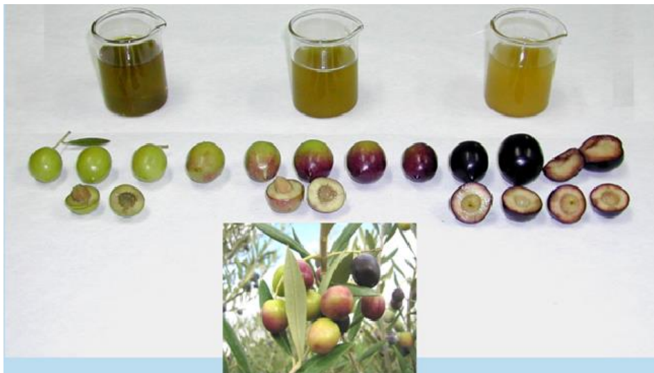
Slika 8. Kategorije na osnovu boje pokožice i pulpe (IOC, 2011)

Indeks zrelosti dobije se primjenom sljedeće formule, gdje A, B, C, D, E, F, G i H predstavljaju broj plodova u svakoj od kategorija (0, 1, 2, 3, 4, 5, 6, 7) :