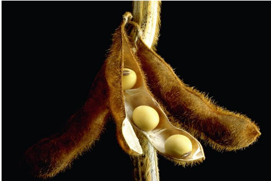
Slika 6. Zrela mahuna soje