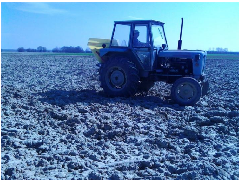
Slika 3. Traktor Rakovica 65

Traktor Rakovica 65 (slika 3.) ima četverocilindrični IMR motor, snage 46 kw, ima 6 brzina naprijed i dvije natrag, maksimalna brzina je 30 km/h, traktor je kupljen nov, 1988. godine. Traktor Rakovica na gospodarstvu obavlja agrotehničke operacije za obavljanje manjih poslova, transport repromaterijala do polja, aplikacija mineralnih gnojiva, sjetva kukuruza. Nakon rada slijedi čišćenje od zemlje, biljnih ostataka i prašine, te garažiranje u poluzatvorenom prostoru, odnosno nadstrešnici.