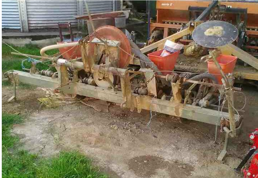
Slika 9. Sijačica PSK 4

regulatora pritiska. U zavisnosti od vremenskog perioda sjetve, obavlja se na dubini od 3-7 cm. Održavanje se sastoji od: podmazivanja svih rotirajućih dijelova litijevom masti Lis 2, podmazivanje pogonskih lanaca, po potrebi radi se skraćivanje lanca, izmjena plastičnih zubčanika ukoliko su napukli ili su se istrošili, podmazivanje pritiskajućih kotača i markira, kardana. Po potrebi radi se izmjena crijeva za protok zraka. Nakon sjetve slijedi čišćenje od zemlje, podmazivanje i garažiranje koje se obavlja u zatvorenom prostoru.