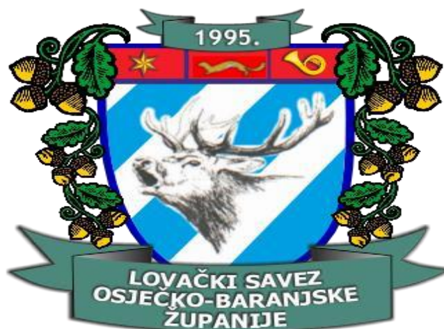
Slika 6. Grb Lovačkog saveza Osječko-baranjske županije

U županiji od 1995. godine djeluje Lovački savez Osječko-baranjske županije. Članice Saveza su s područja bivših općina Beli Manastir, Valpovo, Našice, Donji Miholjac, Osijek i Đakovo. U Lovačkom savezu Osječko-baranjske županije djeluje ukupno 109 članica. Trenutno u Savezu ima 2812 lovaca i 47 lovnih pripravnika. Lovačka društva uglavnom lovišta koriste za odmor i rekreaciju što ne daje značajnu dobrobit u smislu lovnog gospodarstva.