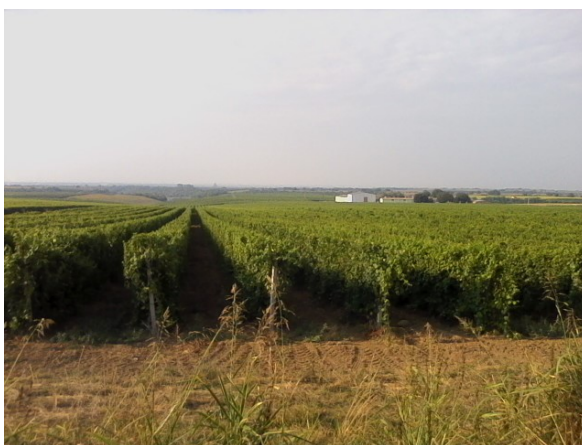
Slika 1. Vinogradi s pogledom na vinariju Vino Ilok d.d.

Nasad vinograda je u jednoj cjelini, uglavnom ravnog, blago nagnutog položaja. Posađeno je oko 4.300 čokota po ha u redove koji su dugi više stotina metara, a manipulativni putevi omogućuju normalan rad, okretanje i prilaz pojedinim dijelovima.