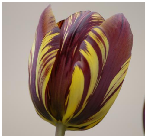
Slika 14. Absalon Tulip

Primjeri: Absalon (žuto-crveni), Cordell Hull (bijeli i crveni), Victory (žuti i smeđi), Glorie de Holland (ljubičasti i bijeli).