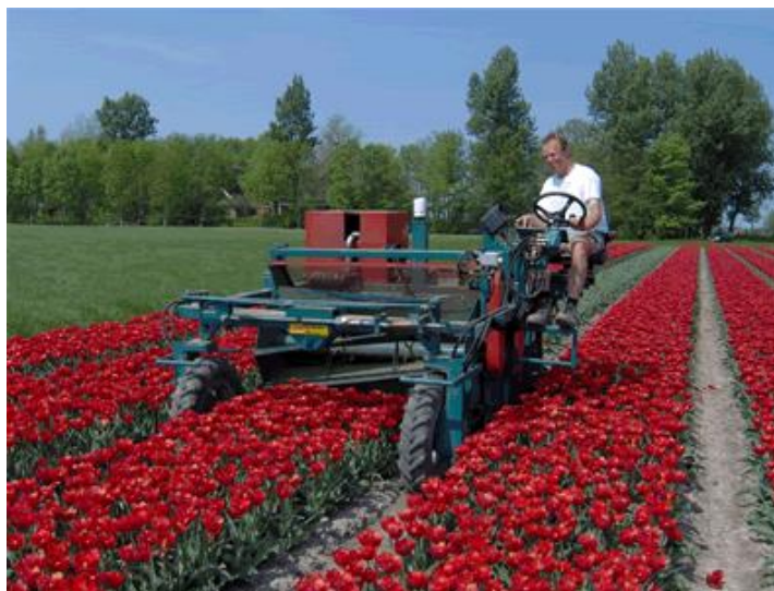
Slika 5. Stroj za rezanje glava tulipana

Cvijet tulipana se reže kada je boja dobro vidljiva, a nije se još potpuno rascvjetao. Pospješivanim tulipanima se cvijet ne reže, već čupa, jer lukovicu više ne trebamo. Inače, cvijet se reže tako da na biljci ostanu još najmanje dva lista (Ahmić, 2016.).