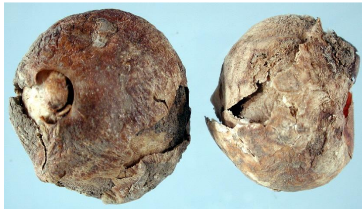
Slika 20. Truljenje lukovica ( Fusarium oxysporum )

Gljivica Fusarium oxysporum uzrokuje truljenje lukovica u skladištu. Pri tome se širi kisel miris i točenje sluzi. Preventivna mjera zaštite protiv napada ove gljivice je držanje na temperaturi od 34°C i relativnoj vlazi vazduha od 80%.