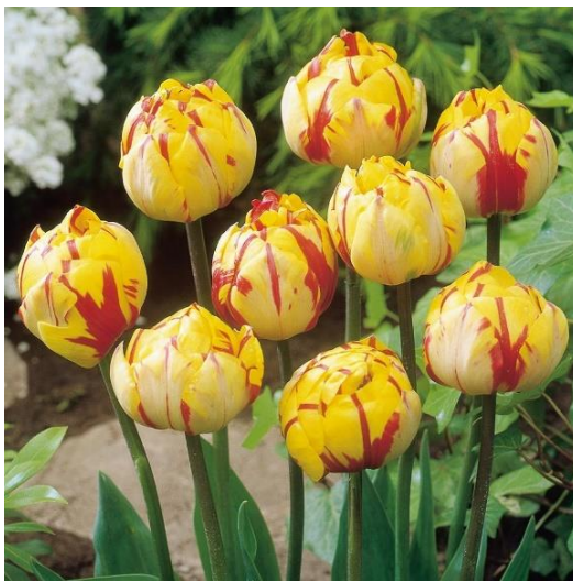
Slika 16. Nizza Tulip

Primjeri: Eros (nježnoružičasti, mirisan), Nizza (žuto-crveni) Moonglow (žuti), Symphonia (crveni).