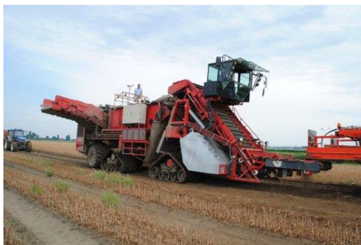
Slika 4. Specijalizirani kombajn za vađenje lukovica tulipana

Lukovice se vade kada vanjska opna poprimi smeđu boju, a nadzemni dijelovi odumru. Tada se lukovice još drže zajedno pa je vađenje jednostavnije. Lukovice se vade plugom ili posebnim kombajnom za vađenje lukovica. Odmah nakon toga, rasprostru se i stave u prozračan prostor. U ovoj fazi ne preporuča se grijanje. Završno, slijedi čišćenje i sortiranje lukovica po veličini.