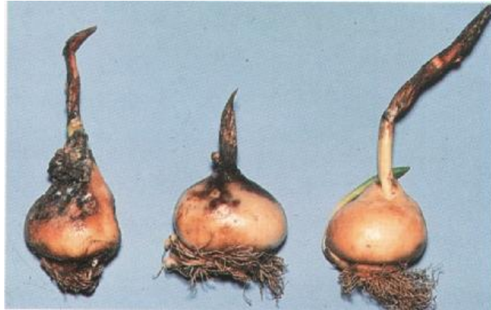
Slika 19. Zaražena lukovica tulipana ( Sclerotium tuliparum )

Siva trulež tulipana ( Sclerotium tuliparum ) može se prepoznati po lukovicama. Iz oboljelih lukovica izbijaju slabi izboji koji se saviju. Budući da se bolest prenosi lukovicama, potrebno je lukovice dezinficirati prije sadnje.