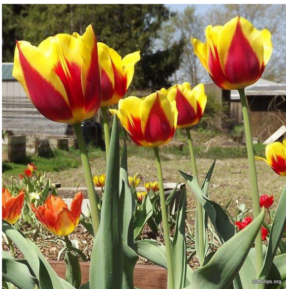
Slika 8. Keizerskroon Tulip

Primjeri: Keizerskroon (žuto-crveni), Brilliant Star (crveni), Bellona (zlatnožuti).