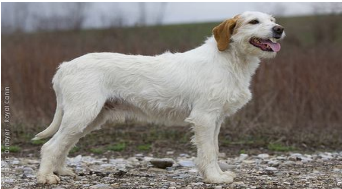
Slika 4. Istarski oštrodlaki gonič