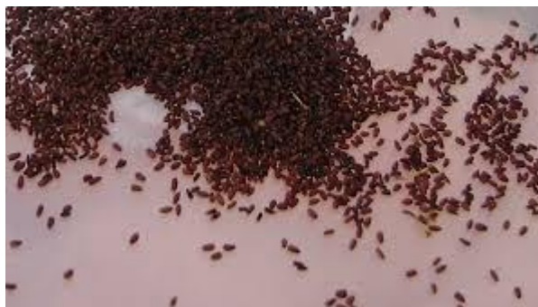
Slika 6. Sjeme smilja (preuzeto iz Pohajda, 2015.).

Smilje se može razmnožavati na dva načina i to generativno (sjemenom) (Slika 6) i vegetativno (reznicama ili dijeljenjem busena).