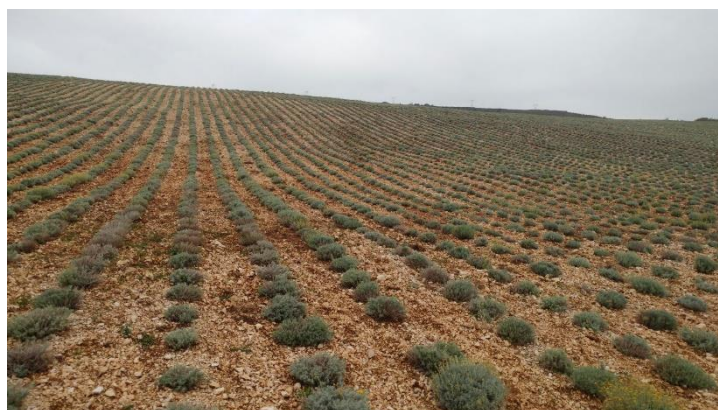
Slika 5. Nasad smilja.

Danas se nastoji ublažiti potreba za branjem samoniklog smilja intenzivnim uzgojem (Slika 5). Naime, tržišni trendovi doveli su do velike potražnje za smiljem kao ljekovite odnosno aromatične biljke. Uslijed toga dolazi do nekontroliranog branja samoniklog bilja i posljedično smanjenja biljnog fonda no i do svjesnosti poljoprivrednika o mogućnosti uzgoja smilja (Rajić i sur., 2015.).