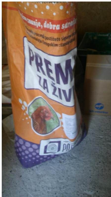
Slika 12. Premik koji se trenutno koristi na farmi