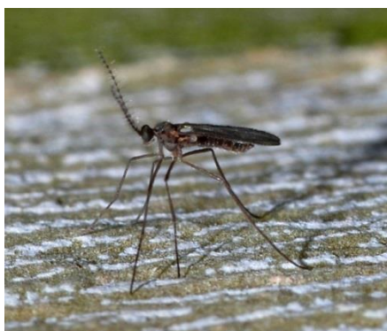
Slika 8. Vrsta iz porodice Cecydomidae.

U nas se vrsta Aphidoletes aphidimyza Rondani spominje kao značajna u suzbijanju lisnih ušiju. Odloži do stotinjak jaja na zaražene biljke, a u promet se stavlja u stadiju kukuljice. Preporuka za suzbijanje je pet jedinki po m 2 (Igrc Barčić i Maceljski, 2001.). Bugg i sur. (2008.) u svom istraživanju nalaze kako je ta vrsta važan prirodni neprijatelj raznih štetočinja, a posebice lisnih ušiju u travno-djetelinskim smjesama.