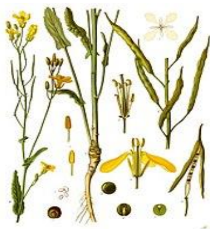
Slika 3. Brassica napus subspec. Oleifera

Uljana repica je danas po važnosti treći izvor jestivih biljnih ulja na svijetu, iza soje i palme. Sjeme uljane repice sadrži 40-48% ulja i 18-25 % bjelančevina. Iz sjemena se prešanjem i ekstrakcijom organskim otapalima dobiva ulje, a kao nusproizvod ostaje sačma koja se koristi u hranidbi stoke. Ulje uljane repice pripada u skupinu polusušivih ulja s jodnim brojem 105 – 126. Repičino ulje se danas proizvodi od sorata i/ili hibrida uljane repice s niskim sadržajem eruka kiseline i niskim sadržajem glukozinolata u sačmi. U Europi se uzgajaju i sorte s visokim sadržajem eruka kiseline i sorte s modificiranim sastavom masnih kiselina za specijalne namjene. U nas se rafinirano ulje uljane repice na tržištu nalazi kao mješavina sa suncokretovim i sojini uljem pod nazivom biljno ulje. Nutritivnim prednostima ulja uljane repice konkurencija je jedino maslinovo ulje. Rafinirano repičino ulje koristi se u domaćinstvu za pripremu jela i u prehrambenoj industriji. Nakon što se katalitički hidrogenira, služi kao komponenta masne faze u proizvodnji različitih vrsta margarina i čvrstih biljnih masti (Pospišil, 2013.).