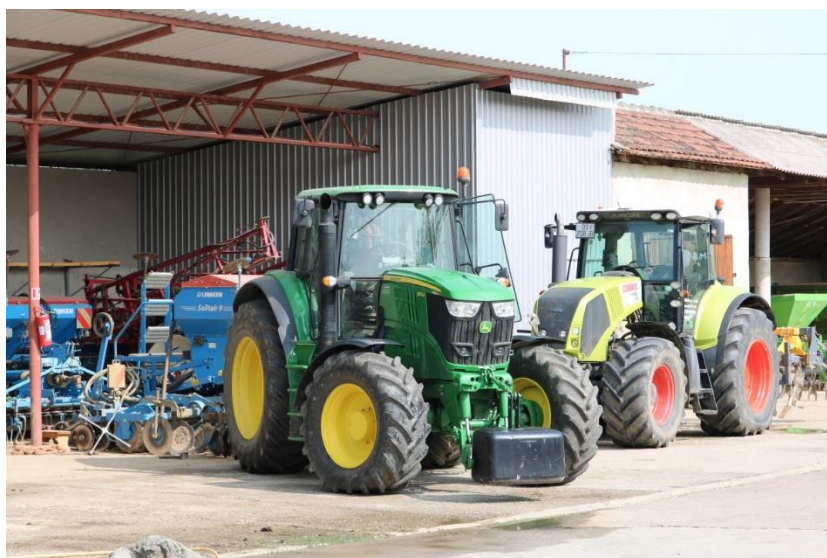
Slika 1. Mehanizacija na OPG-u Dragan Čolaković

Nekoć su se bavili stočarstvom te strpljivo i revno držali krave i bikove, no danas se, s obzirom na stanje u stočarstvu, a i na lokaciju gospodarstva gdje je niža vodoopskrba zbog čega nisu mogli ishoditi dozvolu za izgradnju većeg objekta, bave isključivo ratarstvom, a zahvaljujući tomu, žive od svog rada.