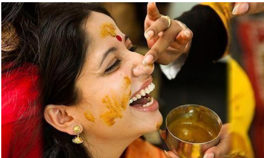
Slika 2. Ukrašavanje kurkumom na tradicionalnim indijskim vjenčanjima

Tumori dojki mogu se liječiti ekstraktima kurkume. U Indiji je kurkuma korištena u ritualima ljepote u vidu njege lica i tijela te u ceremonijama tradicionalnog vjenčanja (slika 2.).