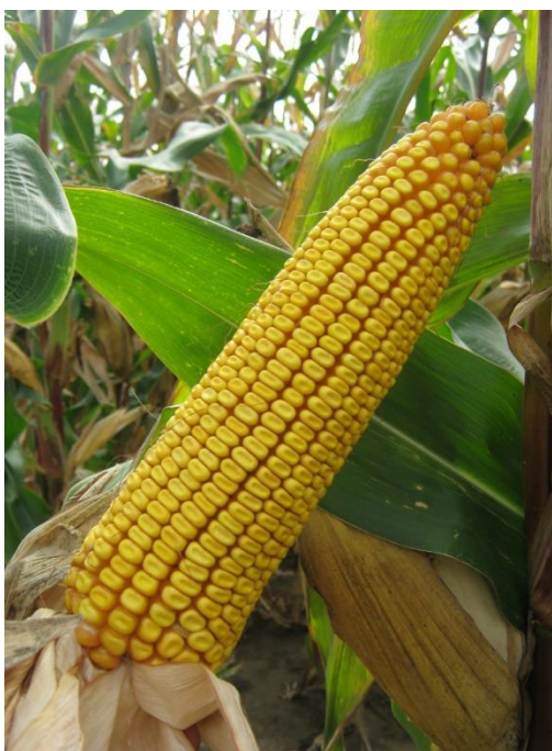
Slika 11. Klip hibrida Drava 404

Na OPG-u „Ivica Podboj“ sjetva kukuruza je izvršena pneumatskom kukuruznom sijačicom. Sjetva je započela u optimalnom agrotehničkom roku 18.04.2019., jer je za ovaj dio Republike Hrvatske optimalni rok sjetve kukuruza od 10.-25. travnja. Dubina sjetve je iznosila od 4-8 cm, na međuredni razmak od 70 cm i razmak unutar reda od 20-25 cm. Na površinama od 5 ha uzgajan je hibrid Drava 404, a na 2 ha hibrid kukuruza Tomasov 400, oba s Poljoprivrednog instituta Osijek. Najprodavaniji OS hibrid kukuruza i najtraženiji u FAO grupi 400. Drava 404 hibrid je iznimne „plastičnosti“, što znači da se odlično prilagođava proizvodnji u najrazličitijim proizvodnim uvjetima. To znači da je ovaj hibrid visoko tolerantan na uzgoj u uvjetima niske opskrbljenosti tla hranjivima i na nedostatak optimalne opskrbljenosti tla vodom. Međutim, u uvjetima primjene visoke razine agrotehnike i u povoljnim klimatskim uvjetima, ovaj hibrid daje svoj puni potencijal rodosti. Navedena svojstva, uz to što je Drava 404 namijenjena za sve vidove proizvodnje (suho zrno, branje, silaža zrna ili cijele biljke) su proizvođači prepoznali u vidu sigurnosti proizvodnje te je to razlog i daljnjeg porasta prodaje ovog hibrida. Izvrstan rani porast, robusna i lisnata stabljika produljenog zelenog stanja te pravilan i krupan klip s dubokim zrnom odlike su Drave 404 (Slika 11.).