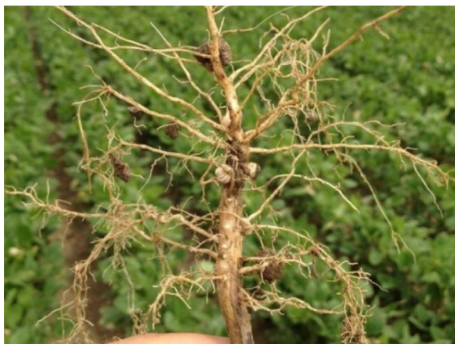
Slika 6. Korijen soje s kvržicama

Korijen – je i velike upojne sposobnosti. Sastoji se od jakog vretenastog korijena i velikog broja sekundarnog korijenja rasprostranjenog u različitim dubinama tla. Glavni korijen dopire do 60 cm dubine, a postrano korijenje i do 150 cm. Korijenove dlačice nastaju tako da žive stanice rizoderme korijena izrastu prema van i formiraju jednostanične tvorevine duge 1,15-8 mm. Budući da dlačice i drugi dijelovi rizoderme nisu prekriveni kutikulom, mogu kroz stijenku “uzimati” vodu iz tla. Dotok vode olakšavaju i tanke stijenke dlačica, koje su zbog tankoće savitljive pa se lako mogu prisloniti uz čestice tla. Na korijenu soje razvijaju se kvržice (lat. nodule ) u kojima žive kvržične bakterije, Rhizobium japonicum (Slika 6.). U kvržicama korijena bakterije žive u simbiozi s biljkom od koje dobivaju ugljikohidrate (šećere), a zauzvrat biljku opskrbljuju dušikom. Kvržice su prave "tvornice" dušika i u njima bakterije pretvaraju anorganski dušik (N 2 ) iz atmosfere, u kojoj ga ima u izobilju (gotovo 80 %) u, za biljku, pristupačni oblik (nitratni dušik, NO 3 - ). Kvržice se počinju stvarati na korijenu soje od trenutka infekcije korijena bakterijama Bradyrhizobium japonicum kroz korijenove dlačice.