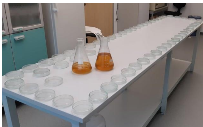
Slika 5. Izlivanje hranjive podloge u Petrijeve zdjelice

Na slici 5 prikazana je priprema za izlivanje hranjive podloge iz Erlenmeyerove tikvice u sterilizirane Petrijeve zdjelice. Petrijeve zdjelice slažu se u posebne aluminijske stalke te se potom stavljaju u autoklav koji ih sterilizira na 120 °C. Nakon završetka procesa bitno je ne otvarati petrijevke do trenutka nasipavanja hranjive podloge.