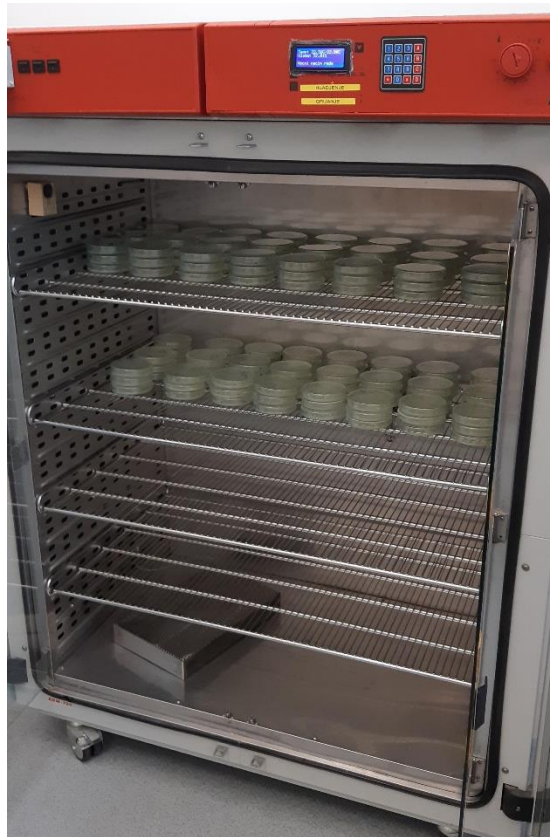
Slika 7. Termostat komora