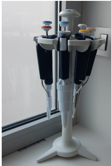
Slika 4. Pipete