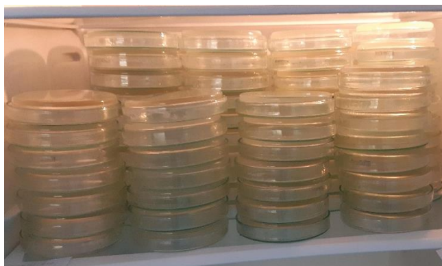
Slika 6. Pripremljene hranjive podloge