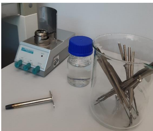
Slika 2. Pribor za postavljanje pokusa

Osim eteričnih ulja, u navedenom je istraživanju korišten i ostali pribor koji je prikazan na sljedećim slikama 2, 3 i 4.