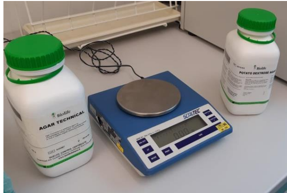
Slika 3. Tehnički agar i krumpir dekstrozni agar