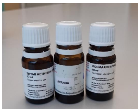
Slika 1. Eterična ulja koja su potrebna za izvođenje pokusa (lavanda, ružmarin i timijan)

Na slici 1 prikazana su eterična ulja koja su korištena prilikom provedbe ovoga eksperimenta.