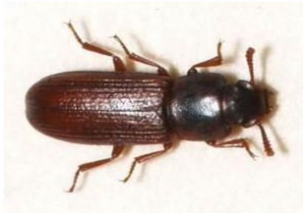
Slika 6. Kestenjasti brašnar ( Tribolium castaneum Herbst)

Najradije napadaju klicu zrna, no napadaju i najrazličitije druge proizvode.