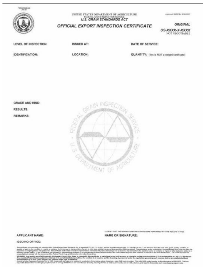
Slika 4. Obrazac Certifikata FGIS-a iz SAD-a

Carinska tijela prilikom svakog uvoza u okviru carinskih kvota 09.0074 i 09.0075 uzimaju radi provođenja ispitivanja uzorke zbog određivanja propisane kvalitete pšenice. Kako bi se osiguralo da su ispunjeni propisani kriteriji kvalitete za primjenu snižene stope carine unutar navedenih carinskih kvota u trenutku puštanja robe u slobodni promet polaže se sredstvo osiguranja, sukladno članku 2. Uredbe (EU) 2020/1987. Propisani iznos osiguranja iznosi 5 eura na 1000 kg. Polaže se i iznos posebnog osiguranja koji je jednak razlici između najviše uvozne carine i carine unutar kvote koja se primjenjuje za navedenu kvalitetu na dan prihvaćanja deklaracije za puštanje u slobodni promet, uz prilaganje prethodno navedenog iznosa osiguranja od 5 eura na 1000 kg. U primjeru kada je uz deklaraciju priložen Certifikat o sukladnosti FGIS-a iz Sjedinjenih Američkih Država ili Canadian Grain Commissiona, izuzetak je da nije potrebno priložiti posebno osiguranje, već se prilaže samo iznos od 5 eura na 1000 kg.