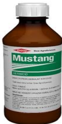
Slika 17. Mustang (herbicid)

Zaštita usjeva 2021. godine počela je nastupom toplijih dana, kada pšenica nastavlja s rastom, a kako bi se nesmetano razvijala potrebno je obaviti tretiranje usjeva protiv korova. Na OPG-u su se ove godine za zaštitu usjeva od korova odlučili koristiti herbicidom po imenu Mustang. Mustang (Slika 17.) je kombinirani sistemski herbicid za suzbijanje sjemenskih širokolisnih korova u ozimoj i jaroj pšenici. Primjenjuje se u dozi od 0,4 – 0,6 l/ha i to u proljeće od početka busanja do pojave prvog koljenca (Agrochem maks d.o.o.)