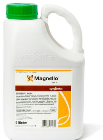
Slika 19. Magnello (fungicid)