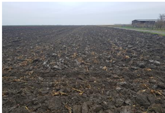
Slika 1. Zimska brazda

Osnovna obrada tla za uzgoj kukuruza na OPG-u se provodi u dva navrata: ljetno i zimsko oranje tj. ljetna i zimska brazda. Ljetna se obavlja u 7. mjesecu nakon žetve pšenice (ili druge strne predkulture) koja je najčešći predusjev na OPG-u. Zimska (Slika 1.) se obavlja najčešće u 10. i 11. mjesecu na dubini od 30-35 cm traktorima IMT 565 i IMT 539 te plugom IMT 757.2 sa dvije brazde koji ima pune daske i plugom Slavonac koji se za potrebe zimskog oranja smanji na jednu brazdu. Tla na OPG-u nisu teška za obradu, stoga je i moguće oranje na toliku dubinu. Zimsko oranje se u sve tri analizirane godine provodilo u razdoblju od 20. listopada do 15. studenog. Nakon oranja u proljeće kada vrijeme dozvoli zatvara se promrzla brazda sa 4-krilnom drljačom i traktorom IMT 565.