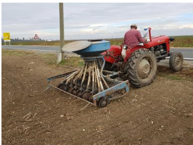
Slika 13. Sjetva pšenice (izvor: Šormaz A.)

Sjetva pšenice za vegetacijsku sezonu 2021. godine je zbog loših vremenskih prilika obavljena izvan granica optimalnog roka. Prvo je obavljena sjetva na najvećoj parceli Žitna tabla 1 (2,09 ha) na kojoj je predusjev bila soja. Ovoga puta, na gospodarstvu su odlučili posijati samo jednu sortu i to Bc Opsesiju koja je bila najrodnija sorta prethodne godine na pokusima u količini od 300 kg/ha. Sjetva je obavljena 28. listopada 2021. godine, a par dana kasnije (03. studenog) posijane su i preostale parcele. Najprije su na parceli Rogač posijali pokuse sjemenarske kuće Bc Institut iz Zagreba s 5 sorata pšenice (Bc Anica, Bc Darija, Bc Ljepotica, Bc Opsesija, Bc Mandica), pridržavajući se sjetvene norme koju propisuju proizvođači. Preostale parcele su posijane s ostatkom sjemena sorti koje su namjenjene za makropokuse.