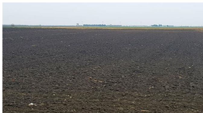
Slika 2. Pripremljeno tlo sjetvospremačem

U proljeće se obavlja predsjetvena priprema (Slika 2.) u jednom proходу sa sjetvospremačem radnog zahvata 2 parna valjka i traktorom IMT 539.