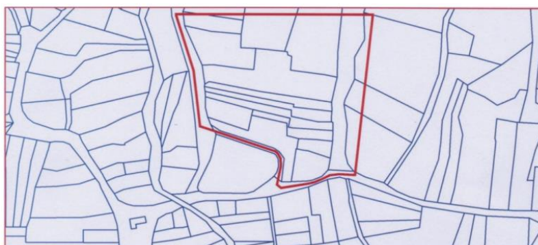
Slika 2 Primjer izgleda poljoprivrednog zemljišta nakon komasacije Izvor: „Značenje primjene komasacije u prošlosti i sadašnjosti uz vrednovanje nekoliko specifičnih lokacija u Požeško-slavonskoj županiji“: http://hrcak.srce.hr/97378 (08.06.2023.)